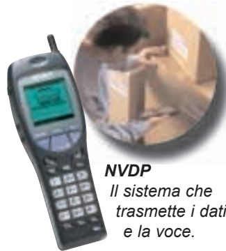
NVDP Il sistema che trasmette i dati e la voce.

...Gestire, organizzare, distribuire, raccogliere dati e informazioni. Statistiche, marketing, e fidelity